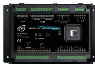
GENSYS COMPACT MAINS CORE VERSION POUR MONTAGE EN FOND D'ARMOIRE

La gamme COMPACT offre une grande flexibilité et un gain de temps grâce à son câblage simple, à toutes les fonctions incluses (sans option), et à une configuration et une programmation simple..