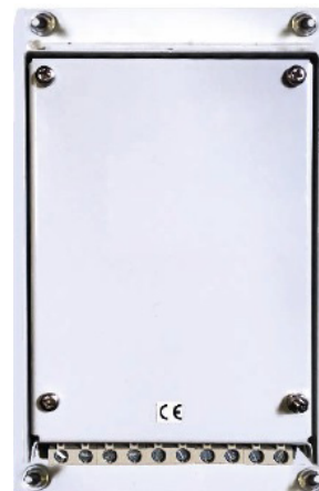
MODULE C2S FACE ARRIÈRE