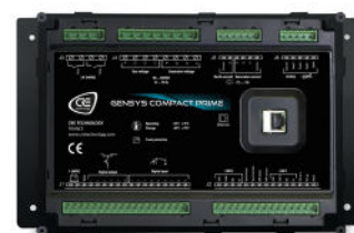
GENSYS COMPACT PRIME CORE VERSION POUR MONTAGE EN FOND D'ARMOIRE